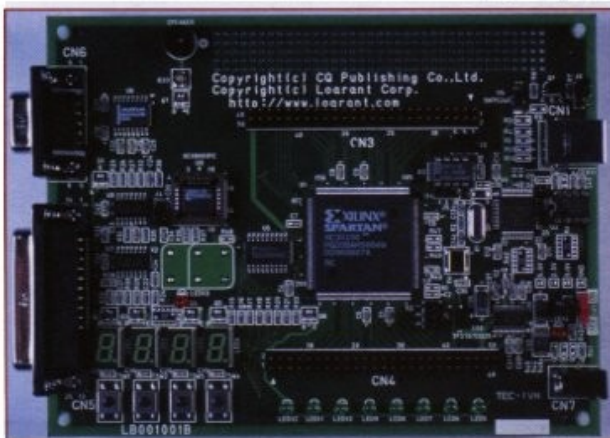
In een herontwerp kunnen nieuwe standaardcomponenten, zoals FPGA's worden opgenomen.